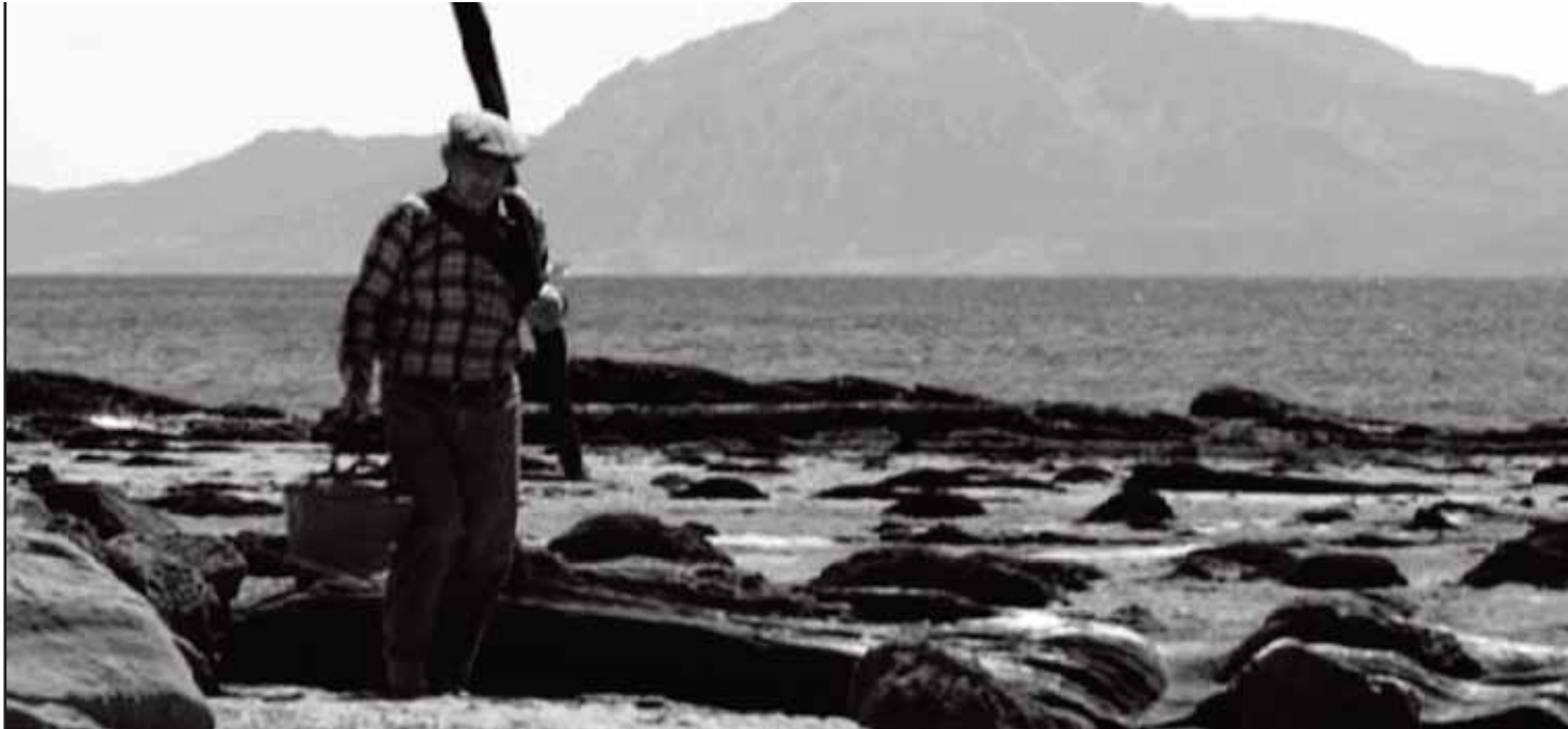
Imagen 1.-Mariscador en La Caleta con Africa al fondo.