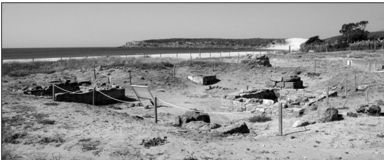
Imagen 3.- Estado actual necrópolis sureste. Área central.

el análisis de los datos extraídos de determinadas campañas de excavación 6 o en otros aspectos más concretos como la tipología de las urnas funerarias 7 o el controvertido tema de los betilos o cipos conocidos como “muñecos” 8 no relacionando en ningún caso las estructuras funerarias exhumadas con las conservadas en el entorno a partir de un análisis microespacial.