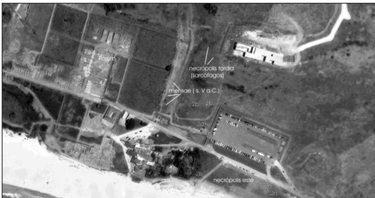
Imagen 5.- Áreas de jerarquización. Necrópolis sureste.

betilo alude a aquellas piedras no alteradas por la mano del hombre o talladas en forma cónica, cuadrangular, ovoidea, troncocónica o estiliforme en las que se pensaba que residía la divinidad 17 . En otro análisis publicado muy recientemente, A. Jiménez defiende la dificultad para encontrar un término aceptable para estas representaciones que caracteriza como un unicum en el panorama arqueológico hispano. Para esta investigadora, los cipos de Baelo Claudia , son “[...] el producto de una recreación muy particular de tradiciones locales, romanas y púnicas[...]” en la que pudo confluír el culto a los ancestros entendidos como entes más o menos indiferenciados y “[...] la idea de la piedra como casa del alma, a la que se ofrecen libaciones y a través de la cual se puede convocar a seres incorpóreos[...].” 18