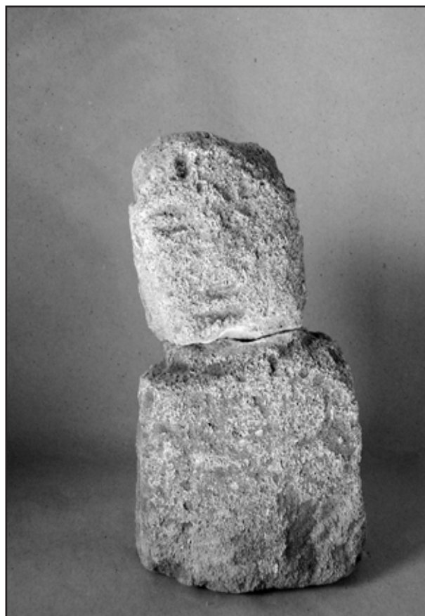
Imagen 4.- “Muñeco” o cipo funerario procedente de la necrópolis sureste (área 2a)

En las últimas dos décadas se han experimentado numerosos avances en el estudio sobre el mundo funerario, tanto en los aspectos conceptuales como en los metodológicos 12 . Además, hay que tener muy en cuenta que las necrópolis configuran en gran medida una de las mayores fuentes de conocimiento de las culturas de la antigüedad. Las fechas en las que la necrópolis oriental de la ciudad romana de Baelo Claudia fue excavada, como hemos visto, son anteriores a la eclosión de dichos avances, por lo que no ha sido, hasta el momento, abordada aplicando las mencionadas novedades que, en el campo del mundo funerario romano, han sido muy significati-