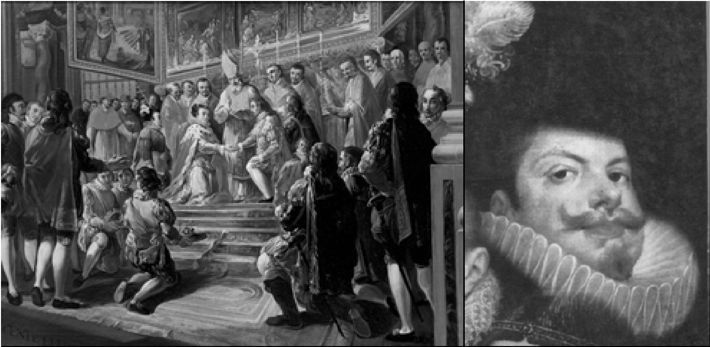
Imagen 1.- A la izquierda matrimonio de Felipe III y Margarita de Austria, a la derecha detalle de un retrato del rey.