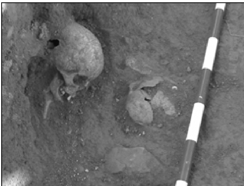
Imagen 3. Restos óseos pertenecientes al osario.