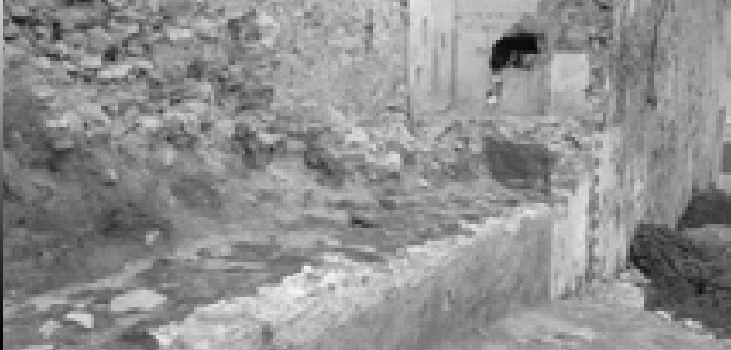
Imagen 1. Detalle del tramo de lienzo de muralla aparecido tras el derribo del teatro Alameda.