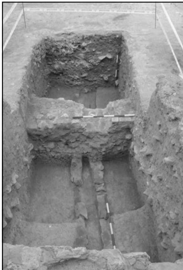
Imagen 5. Detalle de falsabruga y atarjea justo debajo de ésta. Una falsabruga es un muro bajo que para mayor defensa se levanta delante del muro principal.

No menos interesante sin duda alguna es el gran osario colectivo documentado. Estas importantes acumulaciones se han encontrado siempre relegadas a un segundo plano de la investigación. No debemos de olvidar que en ocasiones los osarios no