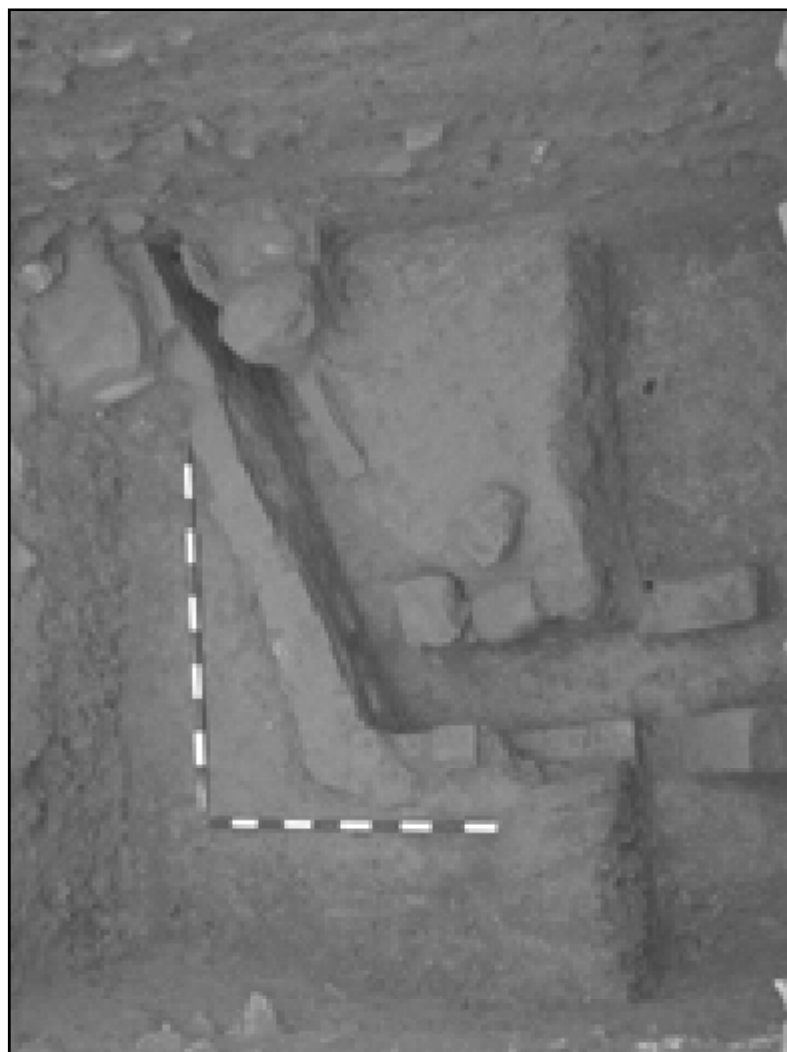
Imagen 6. Atarjea califal. La atarjea es una caja de ladrillo con que se revisten las cañerías para protegerlas.

asociadas claramente a la fosa del enterramiento. Por lo que nos podríamos encontrar ante una inhumación del siglo XVII (imagen 4).